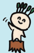
森林保険イメージキャラクター マモルくん

森林保険は、「森林保険法」(昭和12年法律第25号)等に基づき、森林所有者を被保険者として、森林についての火災、気象災、噴火災による損害を総合的に補償するもので、森林所有者が自ら災害に備える唯一のセーフティネットです。